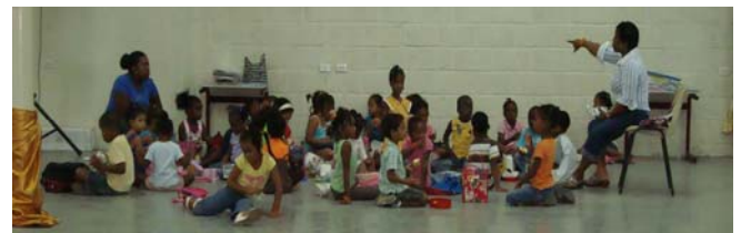
'Fakansi Beibelskol' van Iglesia Bida Nobo Ariba

Als we het over de vakantieactiviteiten gaan hebben is er eigenlijk meer een boekwerk nodig dan een nieuwsbrief, maar laten we het toch maar proberen. fundashon Gideon is het programma begonnen met het meedoen aan de 'Fakansi Beibel Skol' van Iglesia Bida Nobo Ariba. Net als de twee voorgaande jaren dat we bij hen te gast waren was het ook nu weer een succes. Voor de kerk is het een middel om in contact te komen met kinderen uit de wijk waar zij actief zijn.