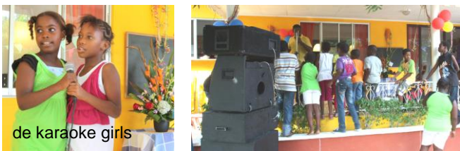
de karaoke girls